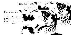
全聯200元禮券 50 名