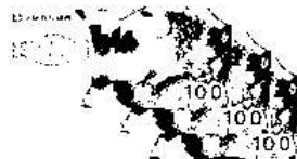
全聯300元禮券 50 名